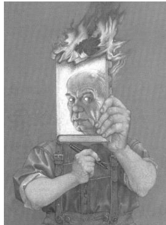
Oskar Maria Graf, Verbrennt mich! , Aquarell, 1994

"Seit einem Vierteljahr arbeite ich wieder täglich fünf, sechs Stunden. Arbeit tut mir gut", schrieb mir Prechtl am 21. Dezember 2002. Aber auch: "Im Januar findet die nächste Kernspinuntersuchung statt, ich hoffe, sie gibt mir weitere Zeit." Diese Hoffnung trog: Vier Wochen vor seinem 77. Geburtstag ist Michael Mathias Prechtl, "Albrecht Dürers jüngster Sohn", der "Denk-Maler", Plakatkünstler und Buchillustrator in Nürnberg seinem Krebsleiden erlegen.