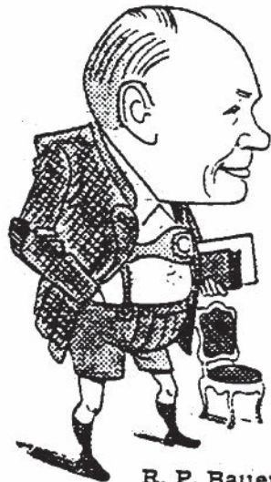
Münchner Merkur, vom 12.12.58