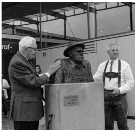
Der ehemalige Oberbürgermeister von München und Minister a.D Hans-Jochen Vogel und OstD Franz Vogl enthüllen die Graf-Büste vor dem Oskar-Maria-Graf-Gymnasium Neufahrn bei Freising

als Ehrengast gewinnen. Zusammen mit dem anderen Vogl, dem Schulleiter, enthüllte dieser die Büste. Und als die Schüler den Trubel, den ihre Idee anfänglich ausgelöst hatte, hinter sich gebracht hatten, an diesem Tag, an dem der Bronze-Oskar