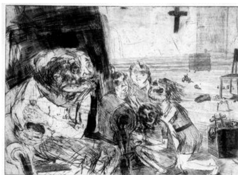
Susanne Theumer: Der Malzzucker

Für eine geplante Ausstellung „Graf und die bildenden Künste“ für die