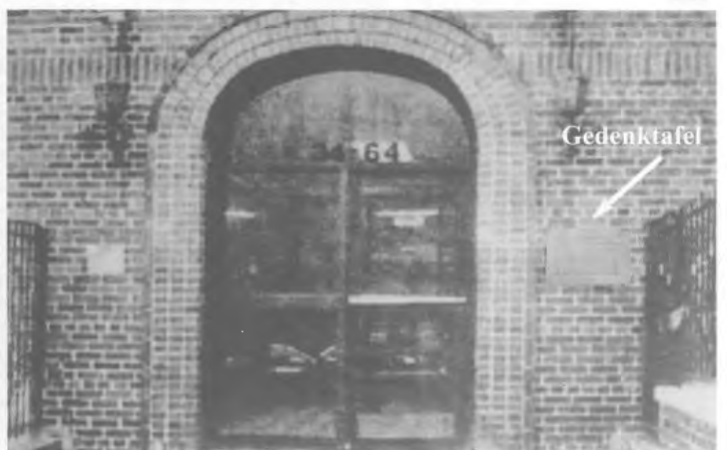
Die Tafel soll rechts des Eingangs angebracht werden.