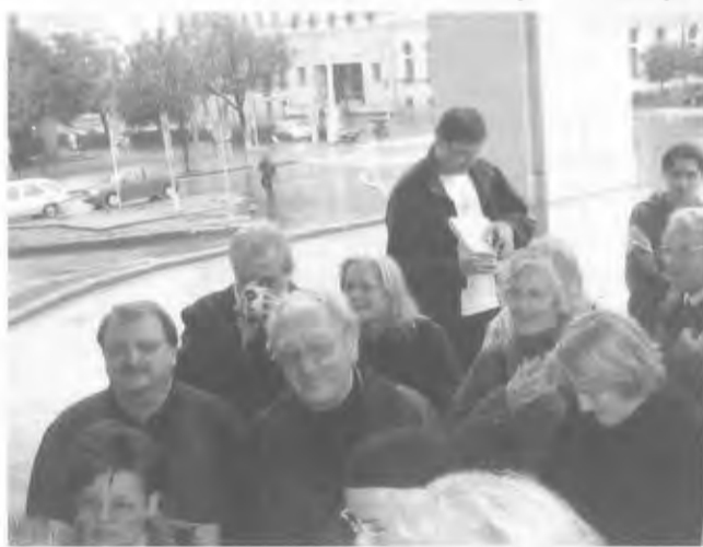
Die Reisegruppe bei der Stadtbesichtigung

Die Heimfahrt kommt uns viel kürzer vor – Brünn ist näher gerückt.